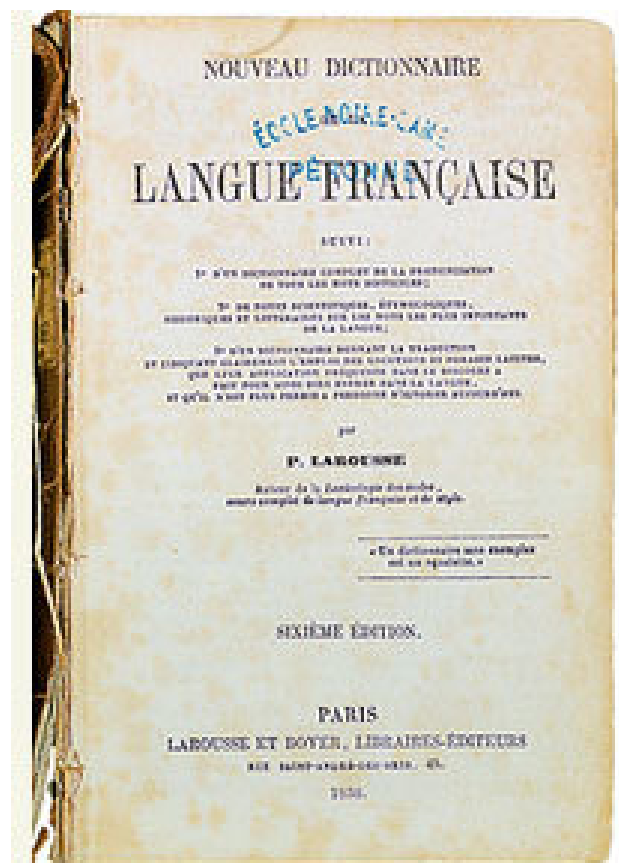
Nouveau Dictionnaire de la langue française, 1856.

C'est ainsi que les langues dénommées vernaculaires deviennent enfin reconnues.