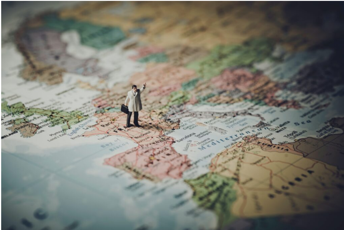
Le français est parlé par 300 millions de locuteurs dans le monde.

Avec 300 millions de locuteurs , la langue française est la cinquième langue la plus parlée dans le monde. Mais connaissez-vous vraiment les origines de la langue française? l-express.ca vous aide à mieux comprendre.